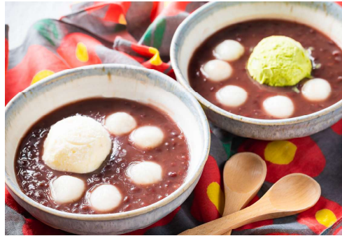
クリームぜんざい バニラ・抹茶 各530円(税込)