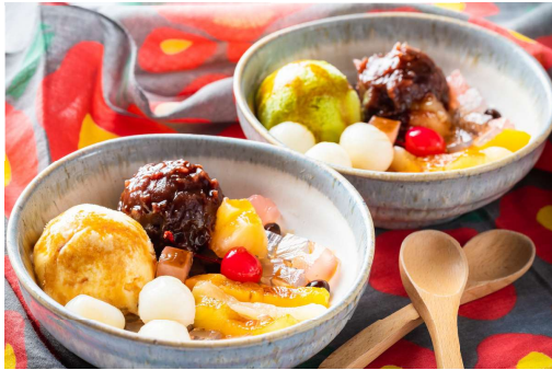
クリームあんみつ バニラ・抹茶 各680円(税込)