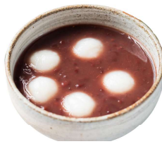
冷やし 白玉ぜんざい 400円(税込)