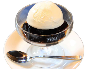
コーヒーゼリー 400円(税込)