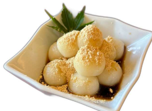
黒蜜きなこ 団子 380円(税込)