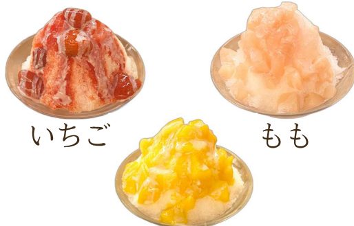
いちご もも マンゴー