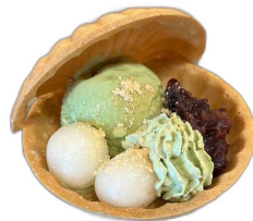
和風もなか 400円(税込)