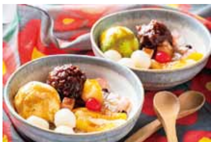
クリームあんみつ (バニラ・抹茶) 650円(税込)