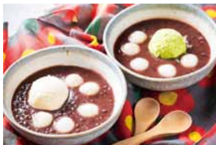
クリームぜんざい (バニラ・抹茶) 500円(税込)