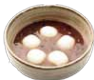
冷やし 白玉ぜんざい 380円(税込)