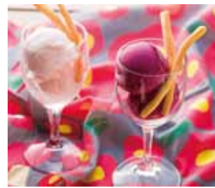
ほうとうかりんとう付き シャーベット 山梨県産 ぶどう もも 各 350円(税込)