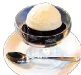
コーヒー ゼリー 380円(税込)