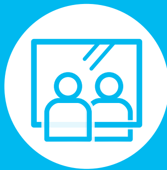
飛沫防止用の シートの設置