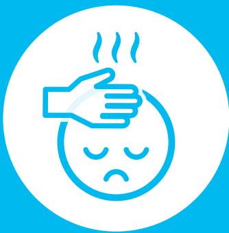
発熱のある方の 入店のご遠慮