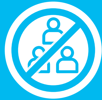
混雑時の 入場制限